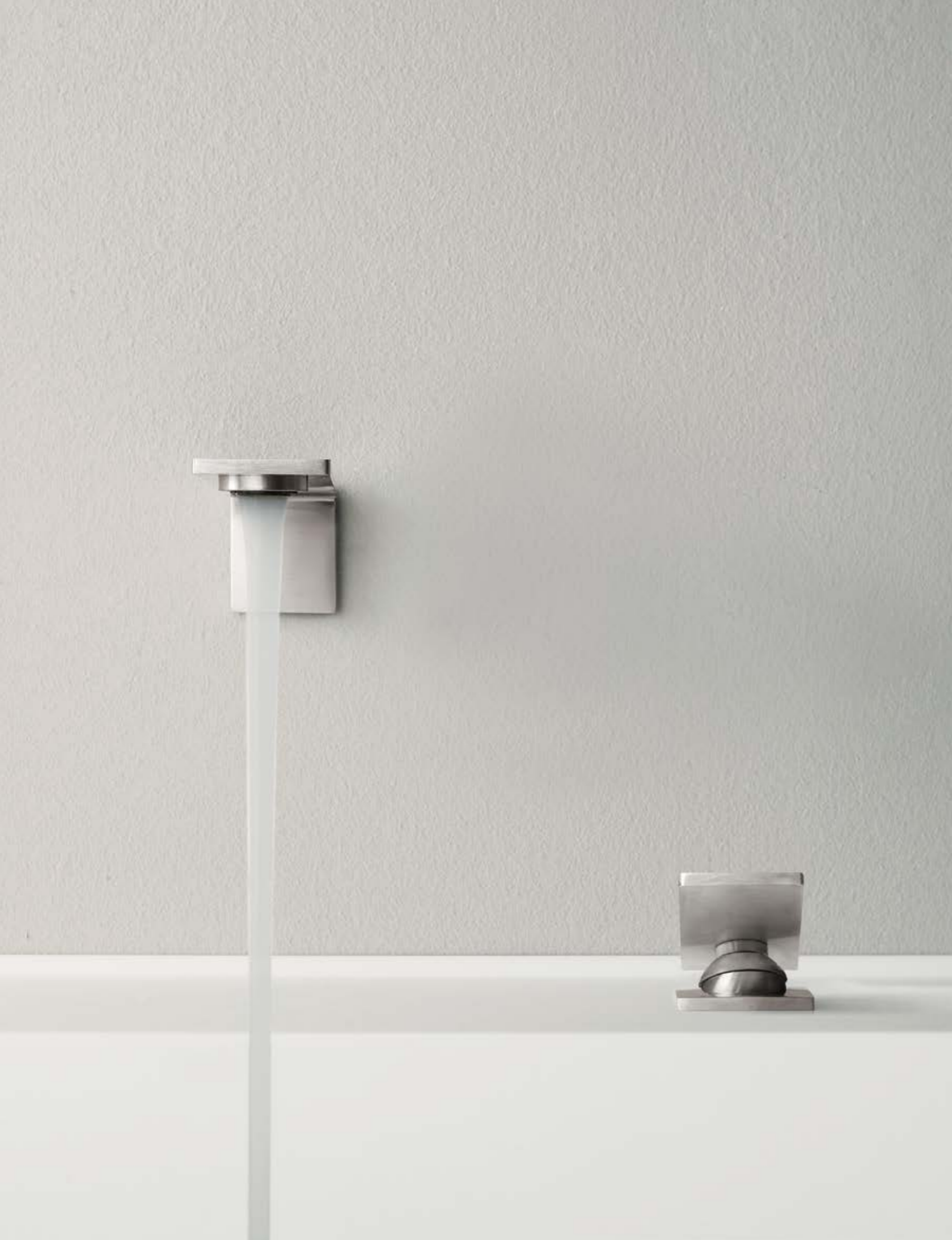
IT 2861 IS ZZ ZZ + RWIT 2865 IS 01