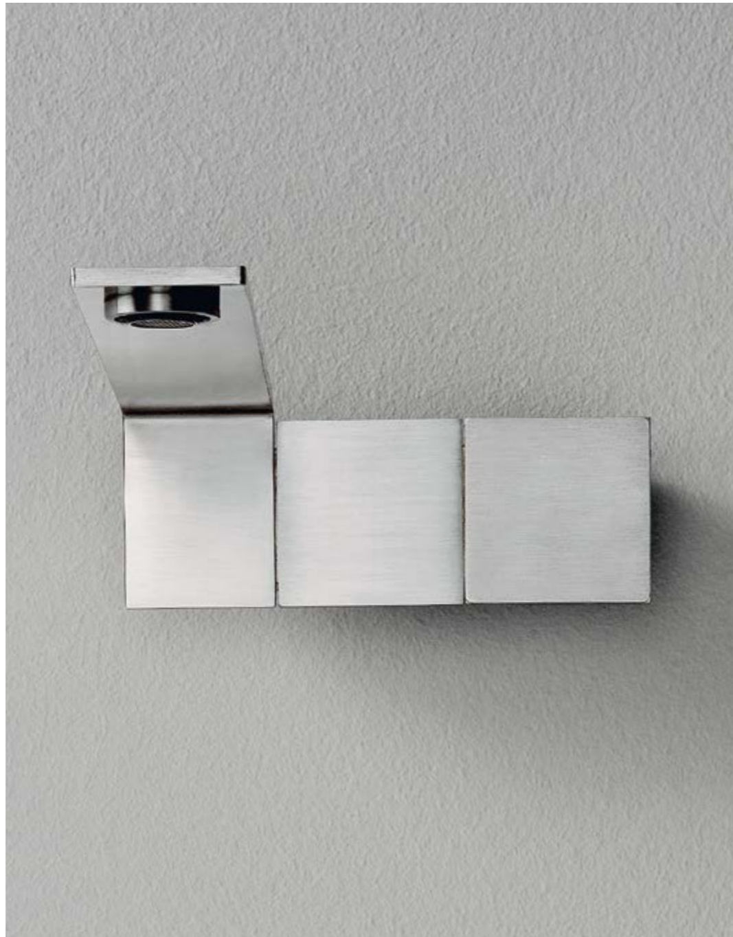
RWIT 2851 IS 96