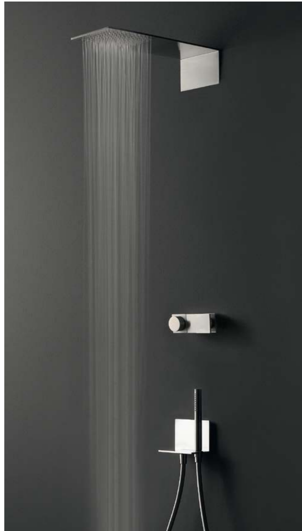
RWIT 2847 IS 01 + RWIT 2849 IS 96 + RWIT 2847 IS 72