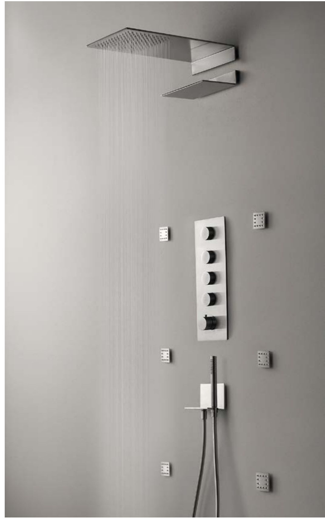
RWIT 2847 IS 52 + RWIT 2597 IS 31 + RWIT 2847 IS 72 + IT RTBR 255 IS x 6