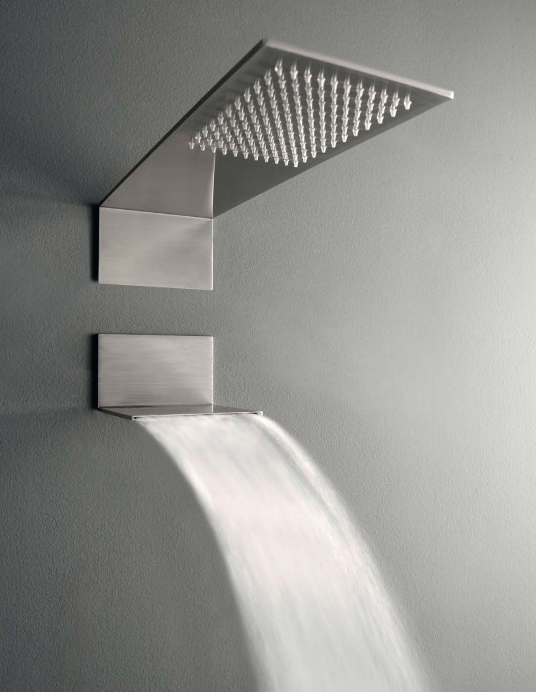
RWIT 2847 IS 01 + RWIT 2847 IS 21