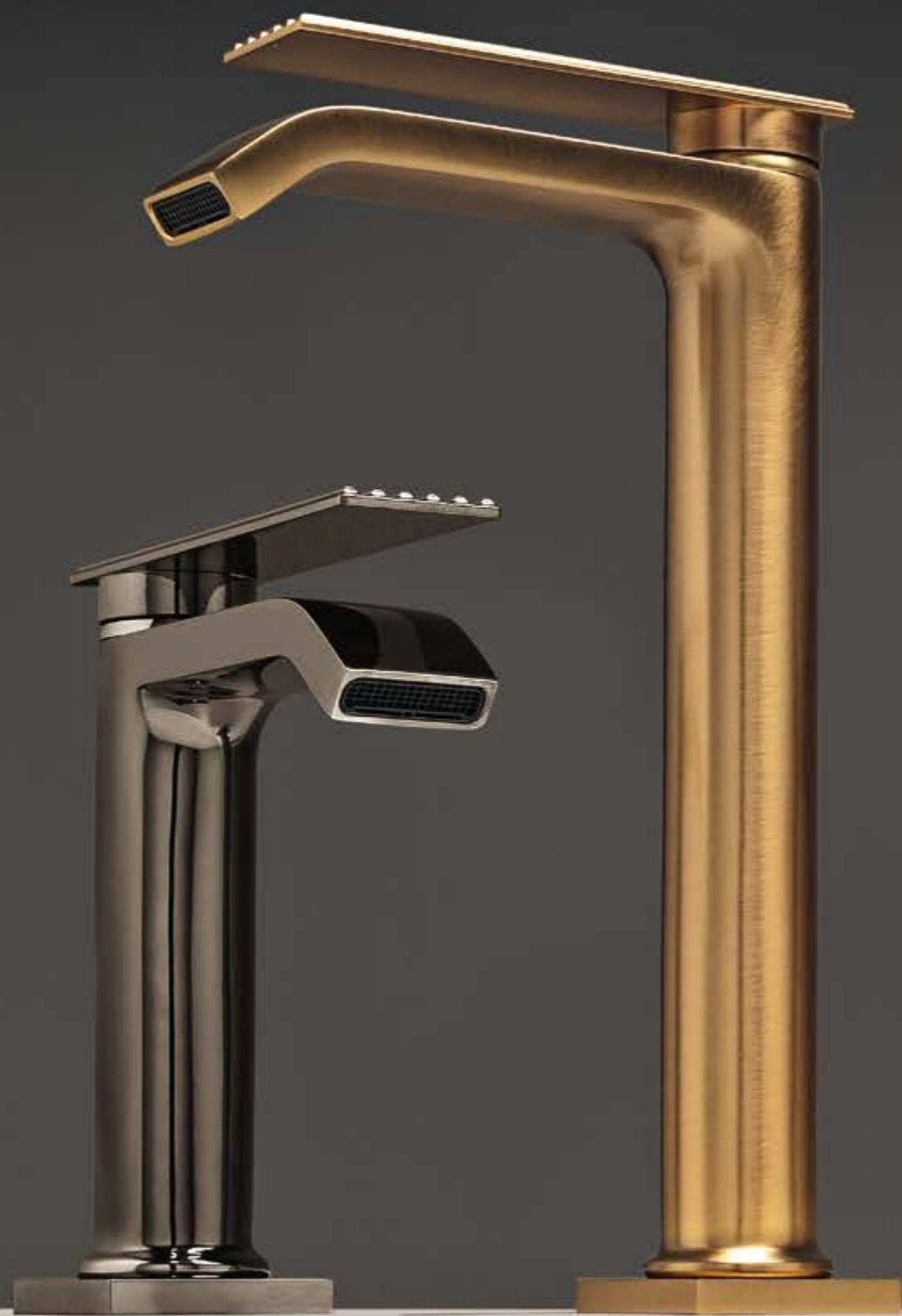
HH polished black chrome