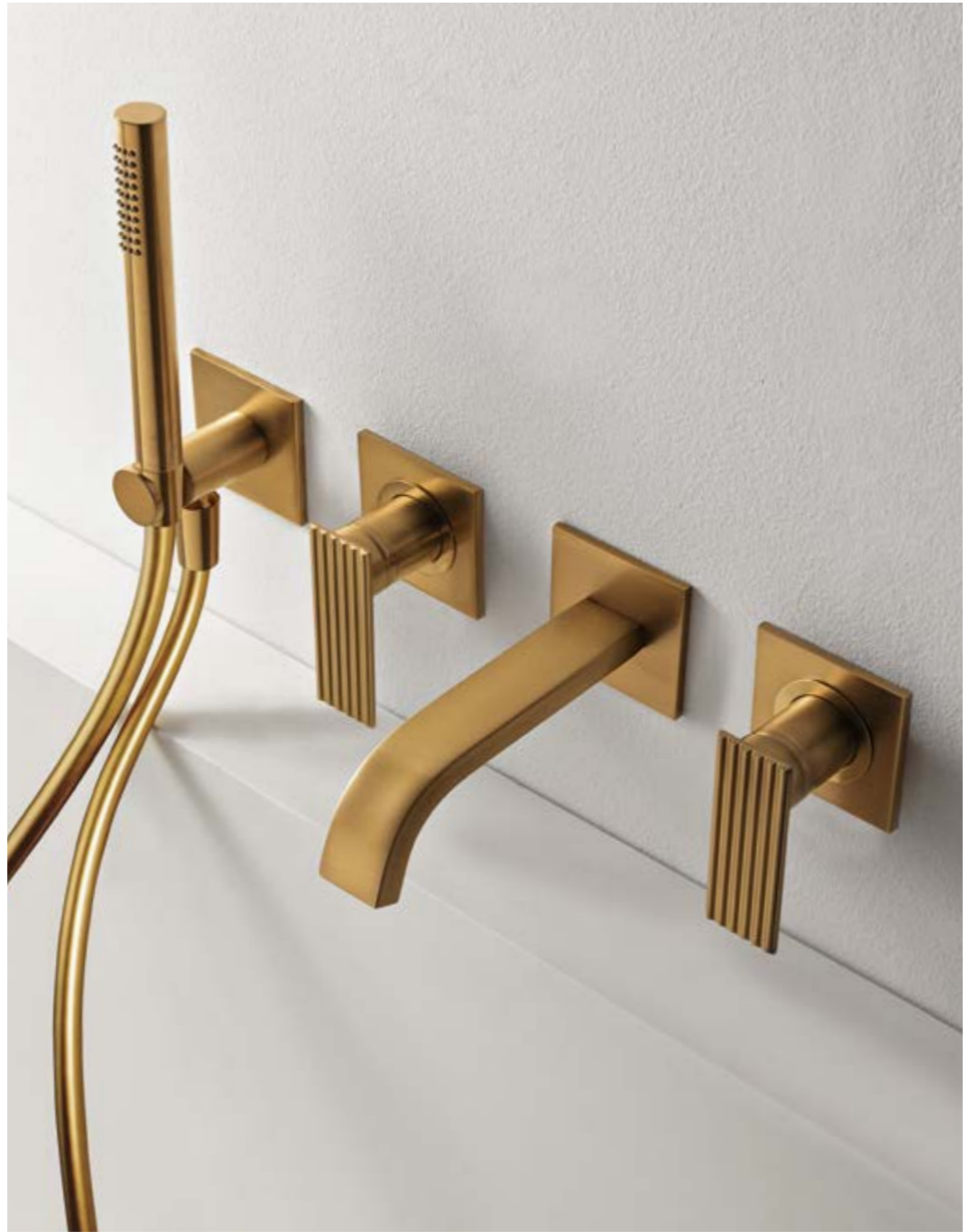
RWIT 2AD8 DZ 01