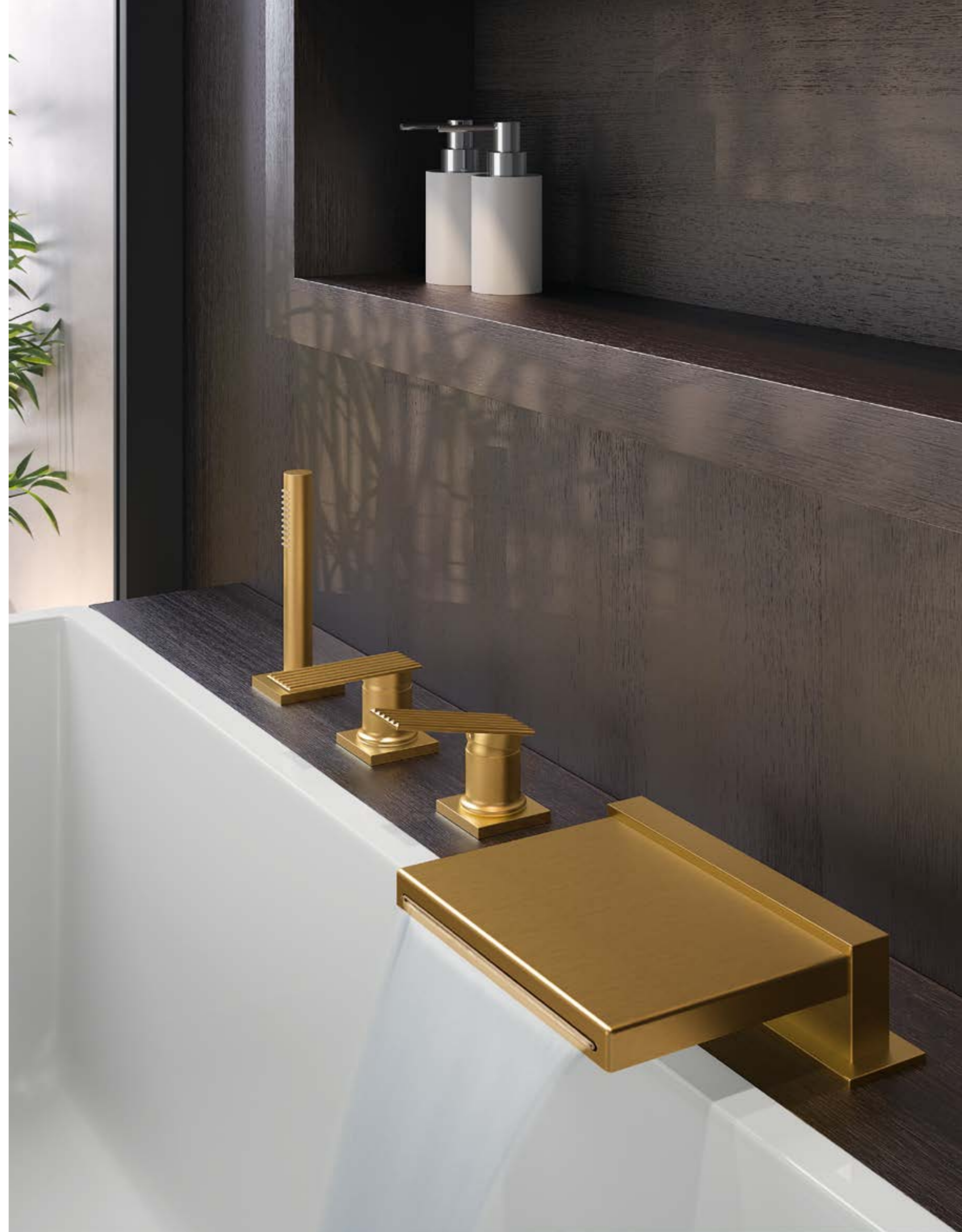
IT 2A68 DZ RM ZZ