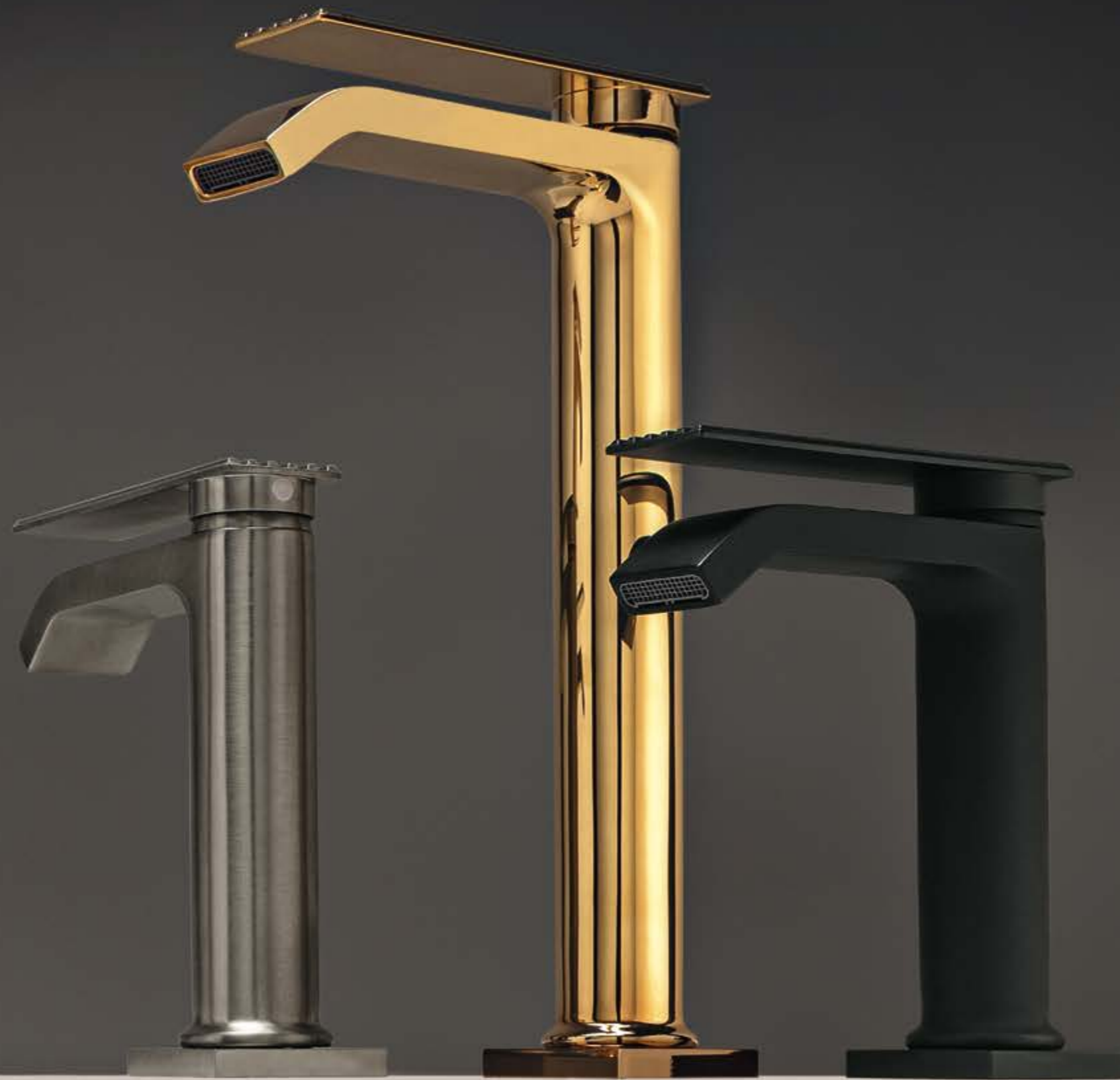
CZ brushed black chrome