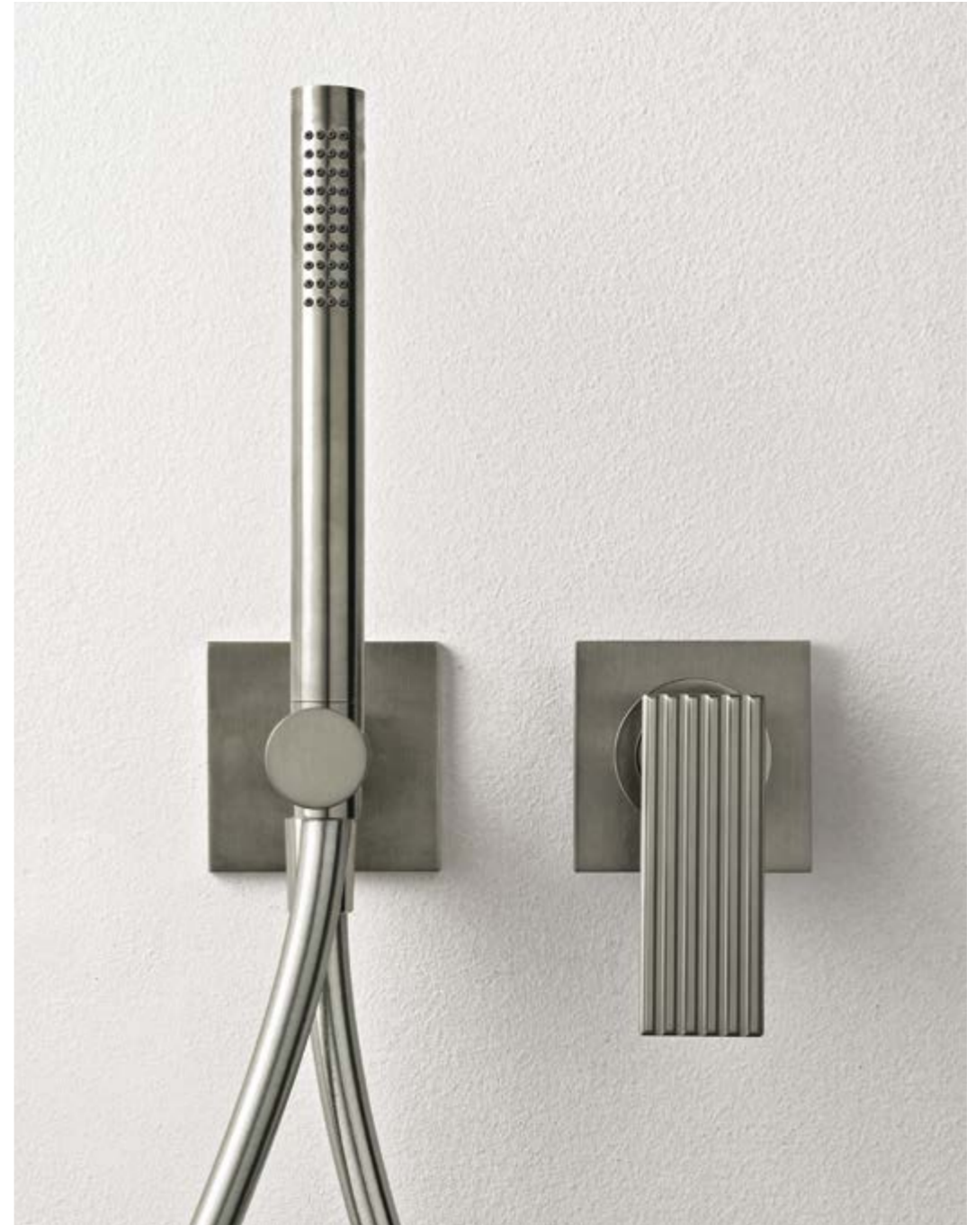
RWIT 2AD4 NF 01

IT RTBR 366 CC + RWIT 2AC3 CC 02 + IT 6529 CC ZZ ZZ + IT RTGA 123 CC