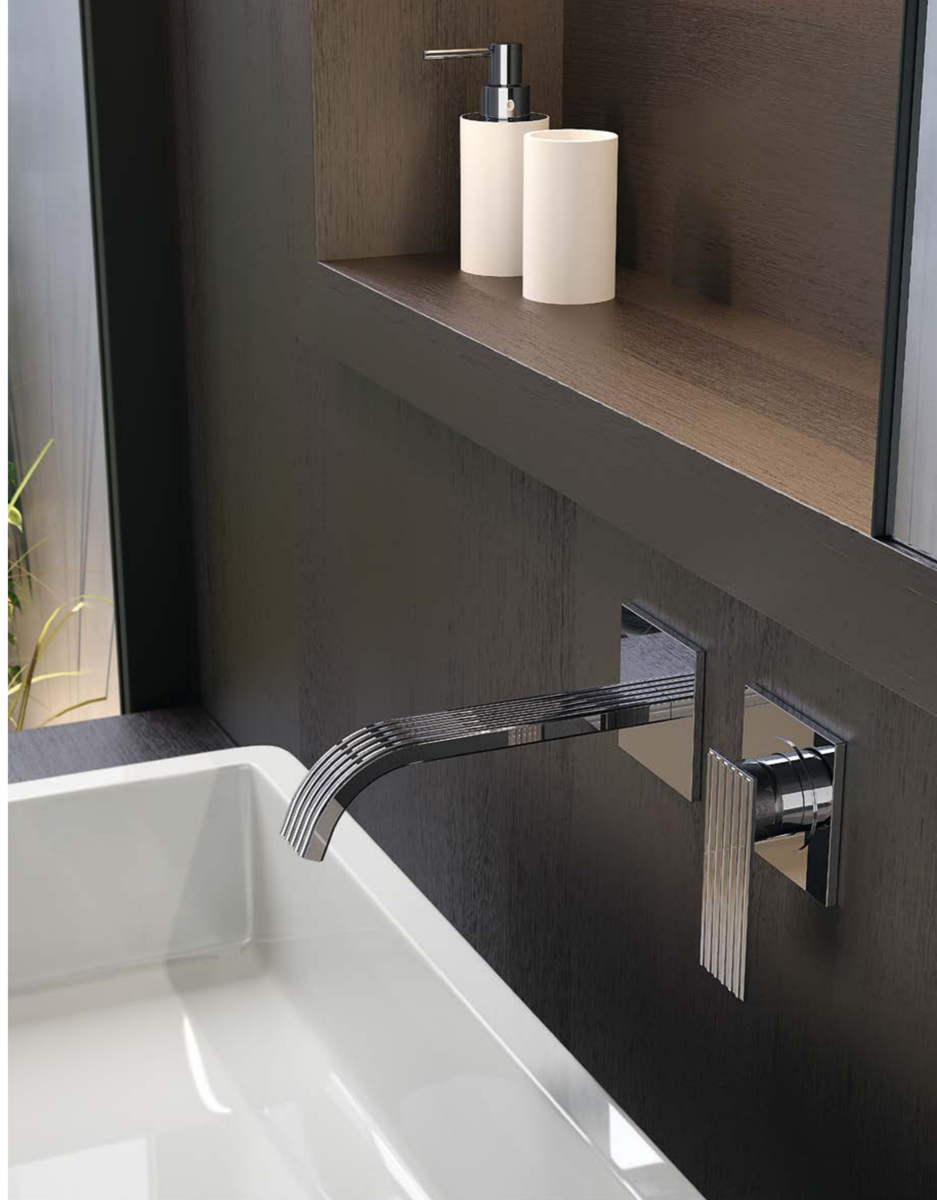
RWIT 2AC5 CC 04