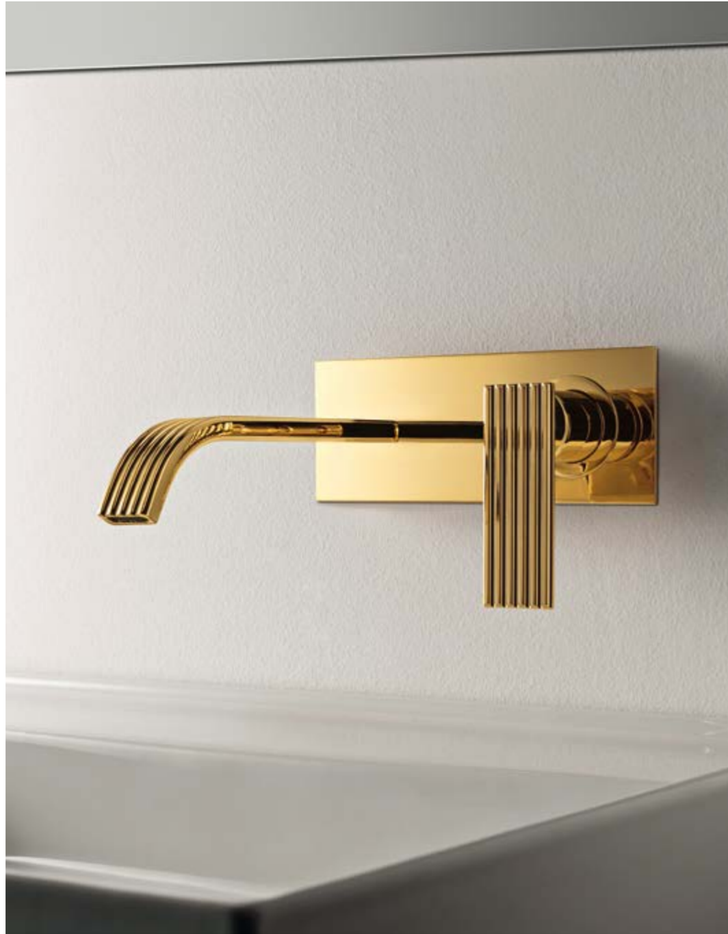
RWIT 2AA5 DD 04