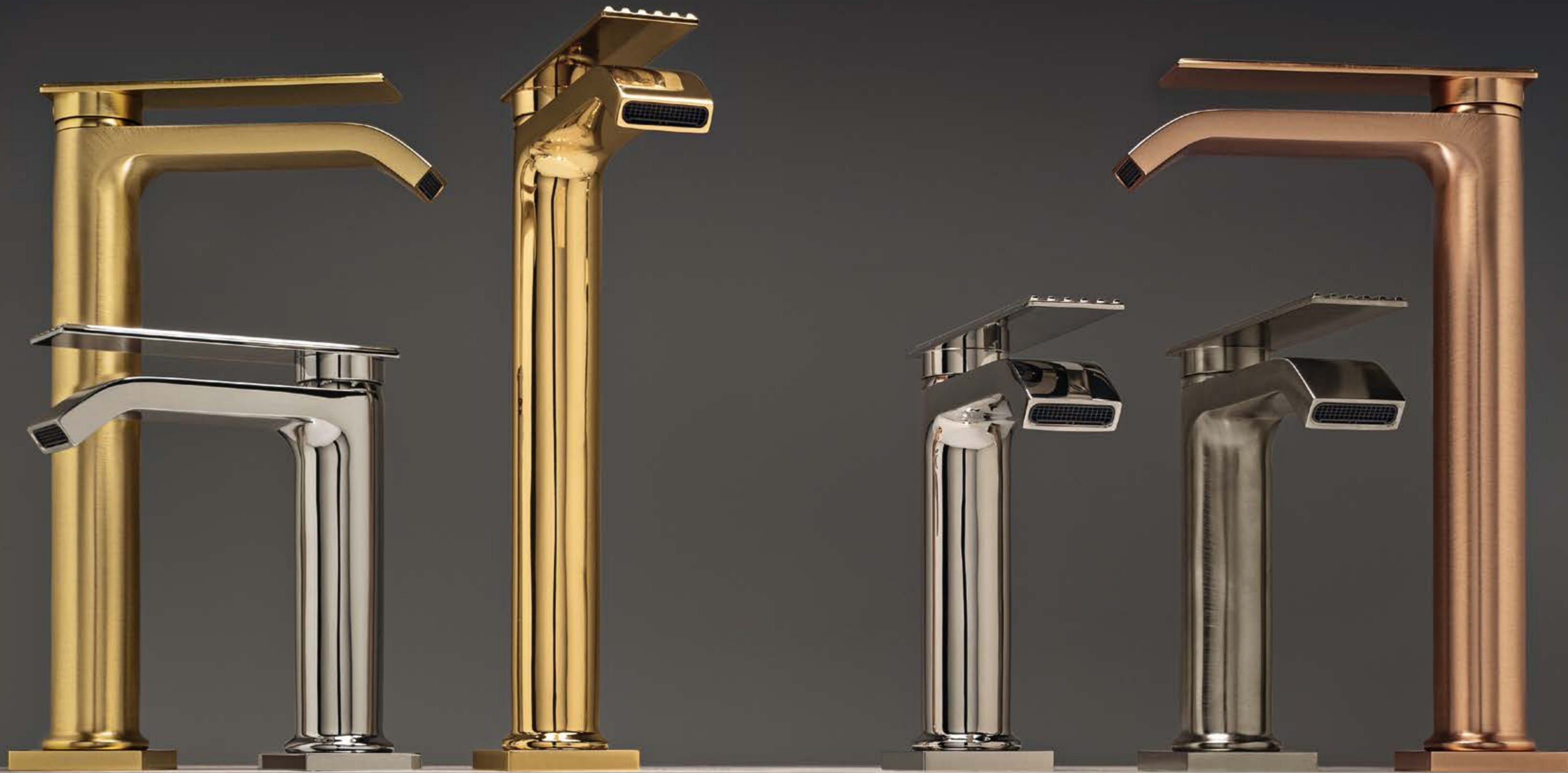
UZ brushed brass