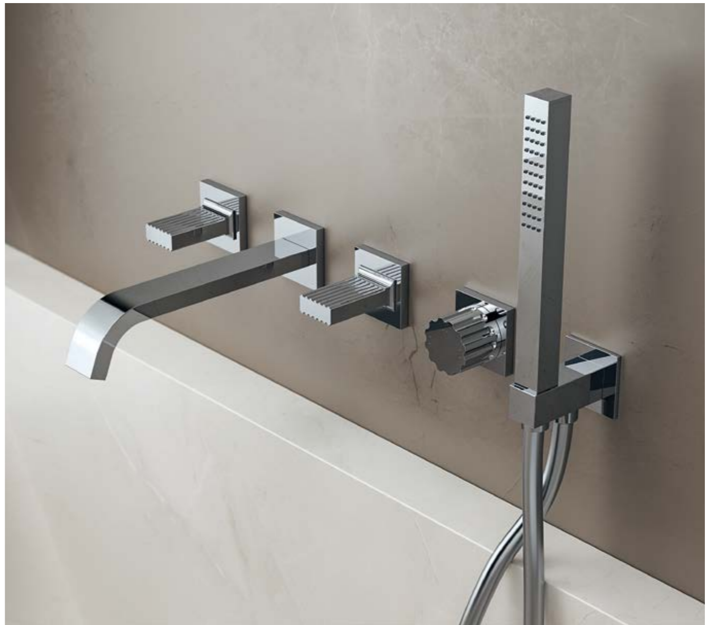
IT 7A63 CC ZZ HF + RWIT 7A40 CC KO x2 + RWIT 7AD5 CC 01 + RWIT 5605 CC 74