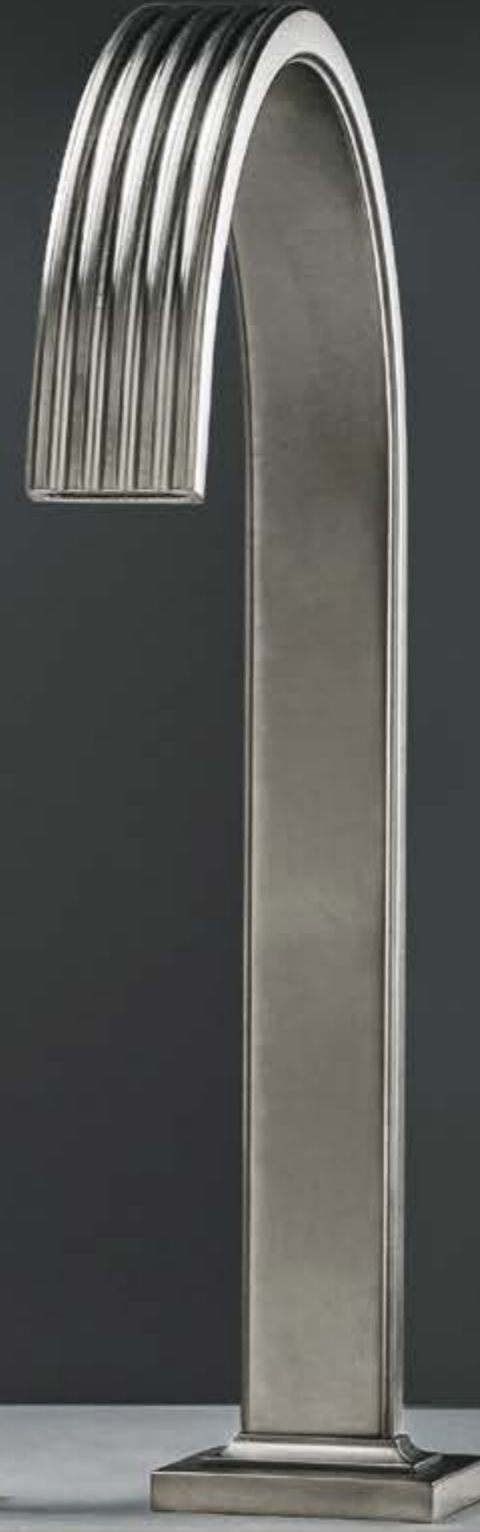
CZ brushed black chrome