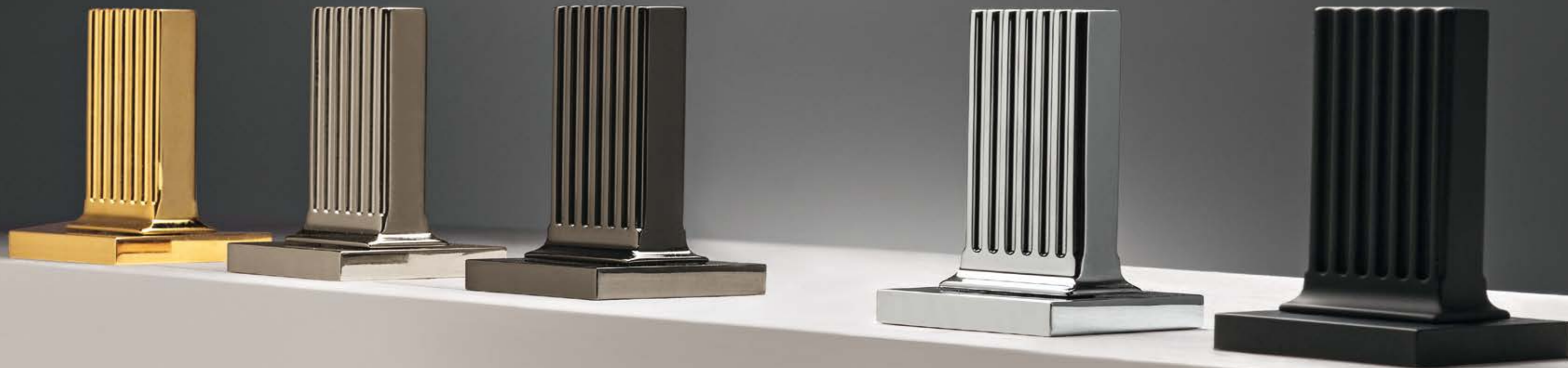
DD gold 24