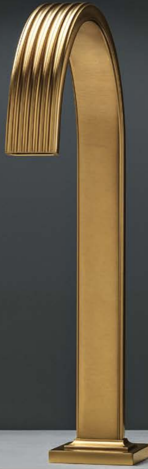
DZ brushed gold