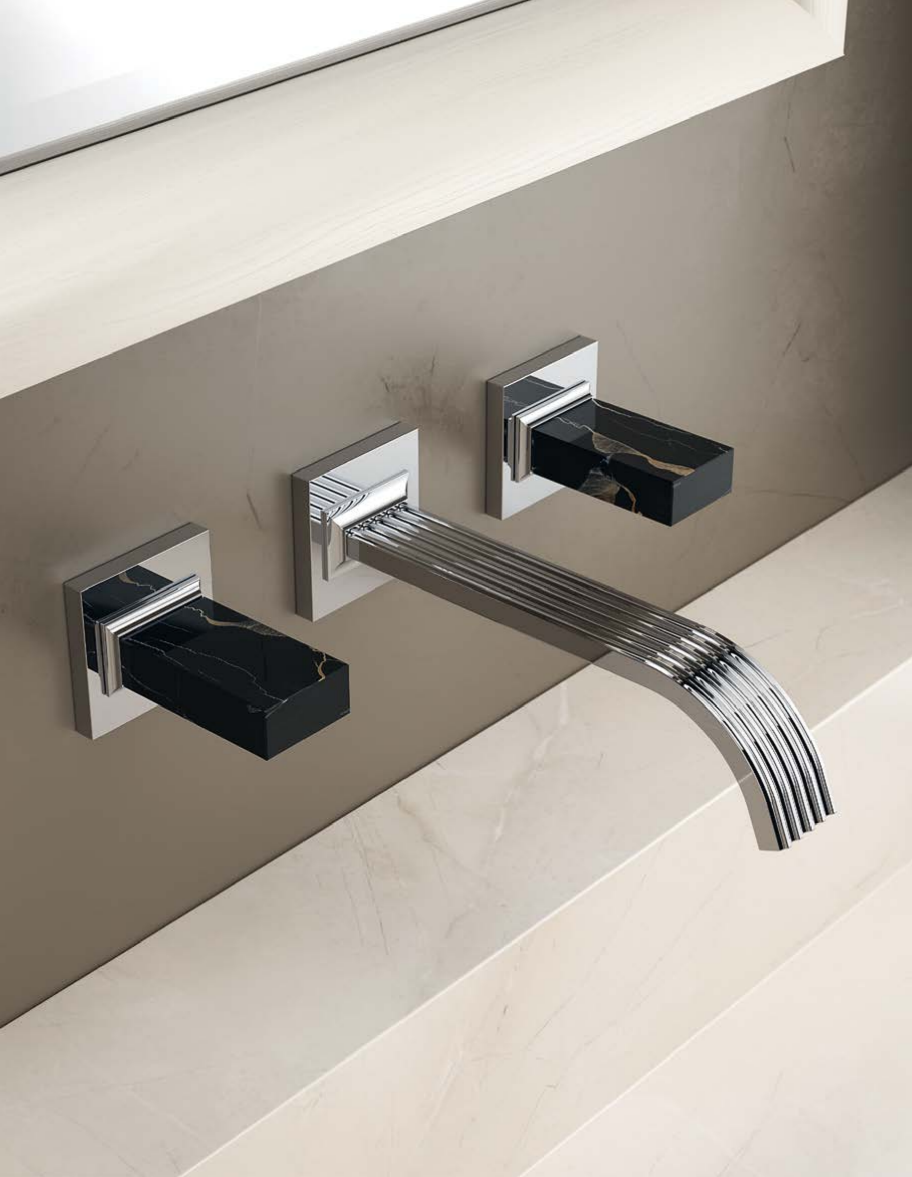
RWIT 7A52 CC K2