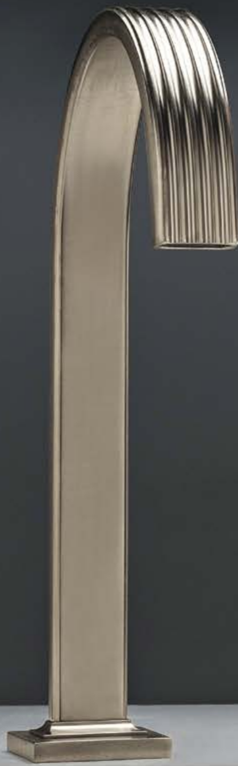
NF brushed nickel