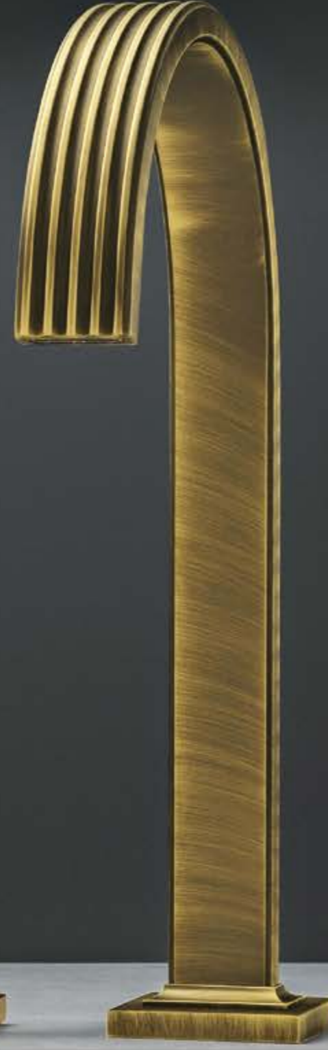
US brushed bronze