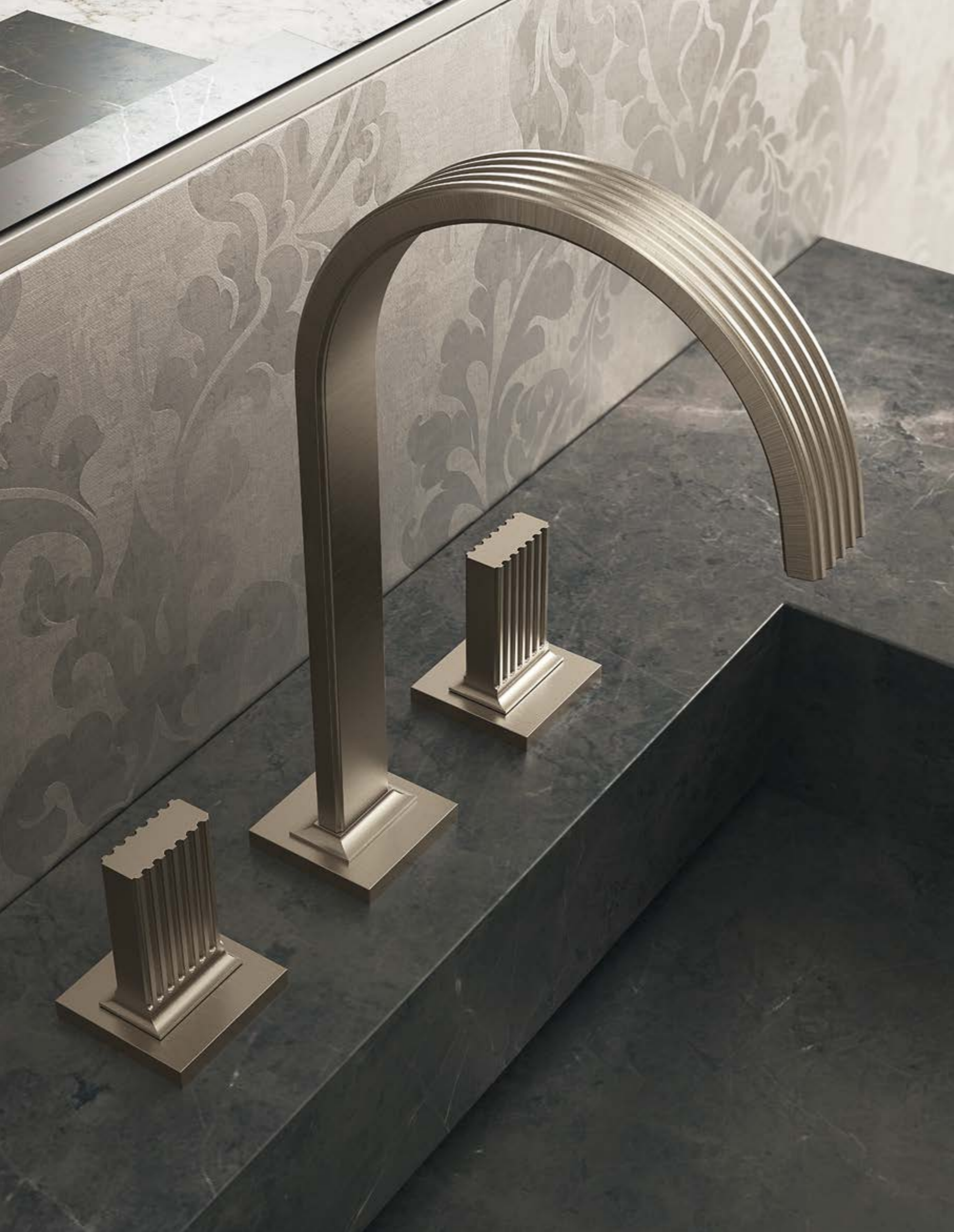
IT 7A16 NF KO ZZ