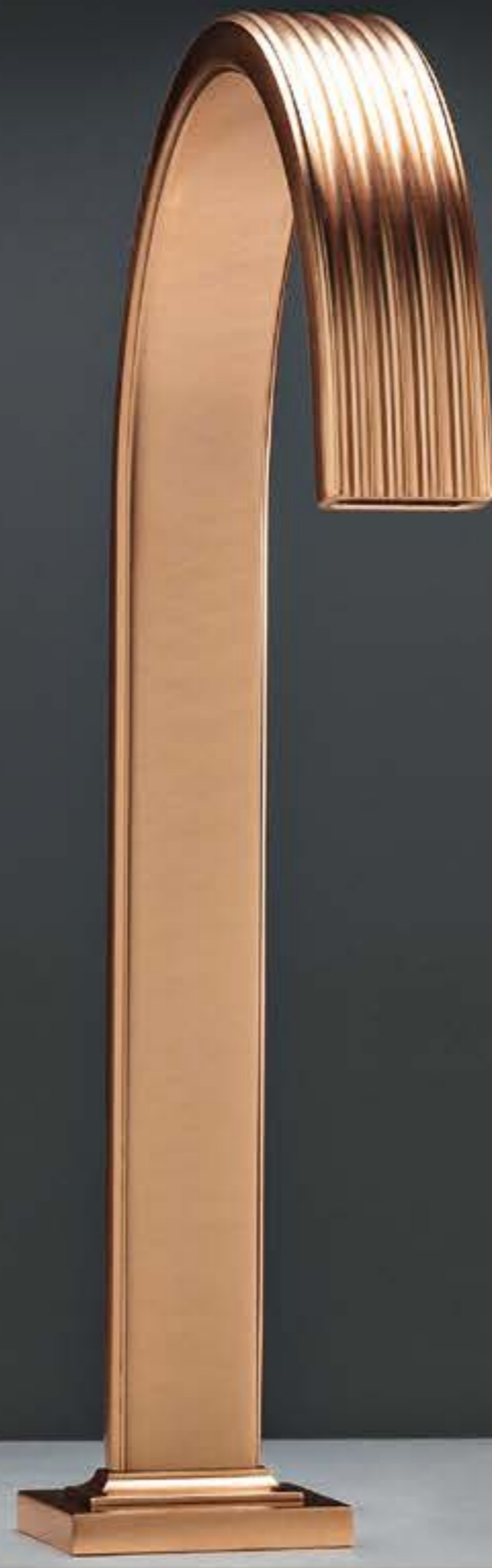
SZ brushed rose gold