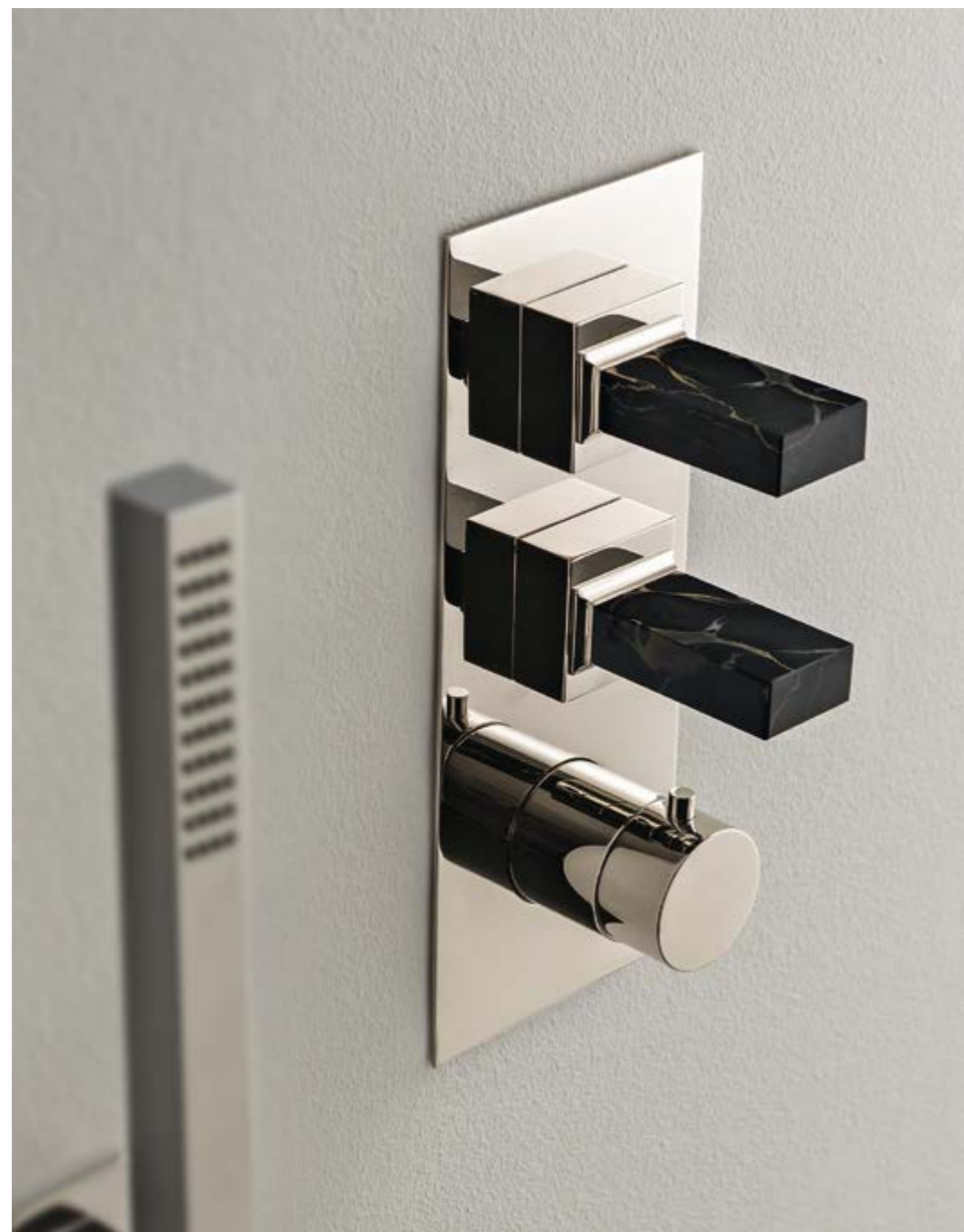
RWIT 7A86 NL K2