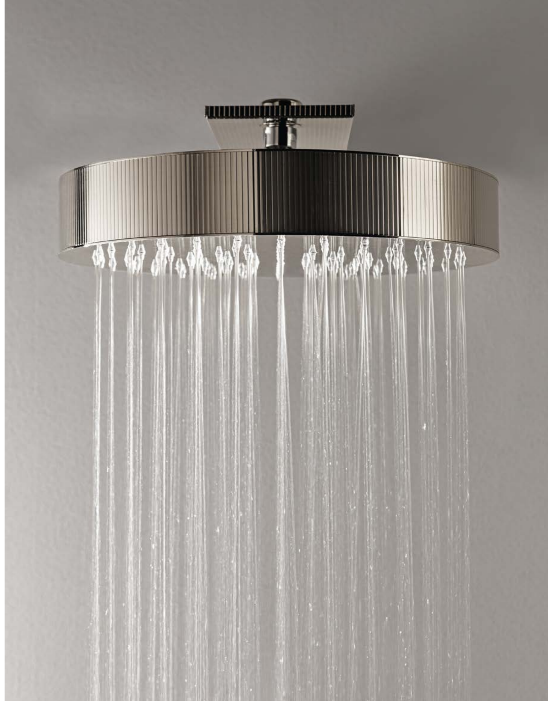
IT RTBR 380 NL