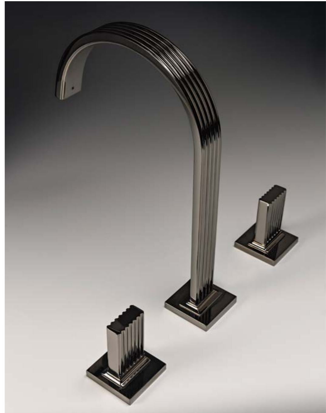
IT 7A16 HH KO ZZ