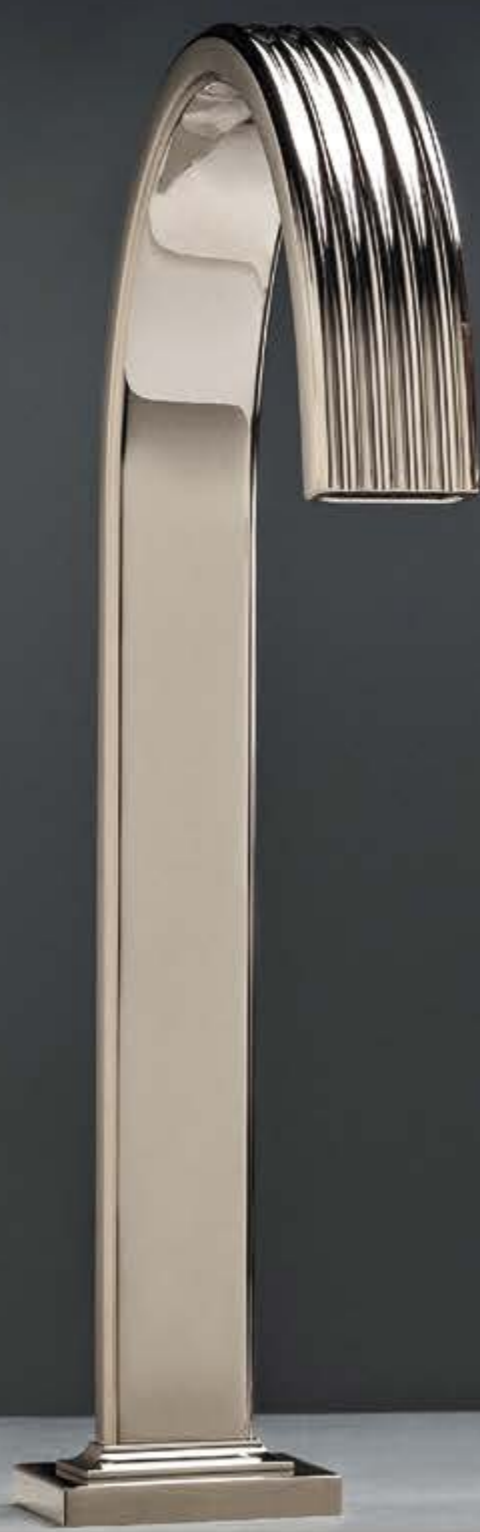
NL polished nickel