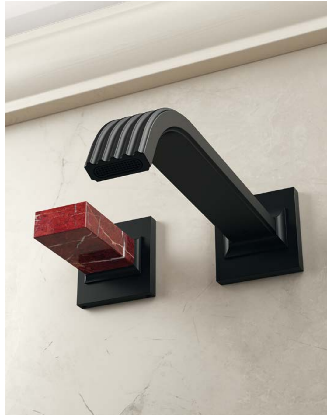
RWIT 7A52 NN K3